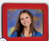
16 ZDJĘCIE W RAMCE Z MAGNESEM 8,5 x 11 cm - CENA 18 zł