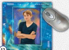
13 ZDJĘCIE W PODKŁADCE POD MYSZKĘ 23 x 23 cm - CENA 23 zł