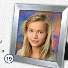
19 PORTRET W SREBRNEJ RAMCE PŁASTIKOWEJ 21 x 21 cm - CENA 29 zł