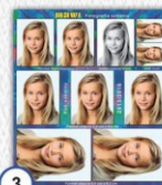
3 ZESTAW ZDJĘĆ: FORMAT DO LEGITYMACJI, KARTY ROWEROWEJ, ZDJĘCIE CZARNO BIAŁE I INNE FORMATY OKAZJONALNE - CENA 13 ZŁ.