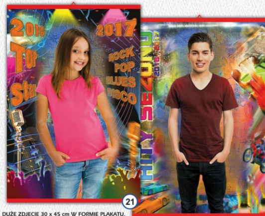
21 DUŻE ZDJĘCIE 30 x 45 cm W FORMIE PLAKATU, OLISTWOWANE - CENA 27 zł