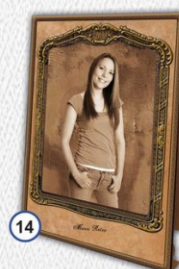
14 ZDJĘCIE W SEPII W RAMCE TEKSTUROWEJ 17 x 24 cm - CENA 22 zł