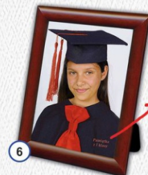
6 PORTRET Z NALOŻONĄ CYFROWO TOGĄ W RAMCE PŁASTIKOWEJ 20 x 26 cm - CENA 33 zł