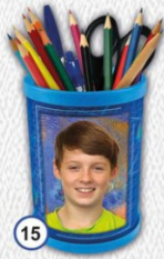
15 ZDJĘCIE W POJEMNIKU NA PRZYBORY SZKOLNE 8 x 11 cm - CENA 21 zł