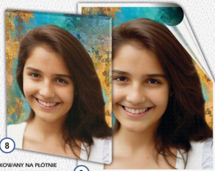
8 PORTRET DRUKOWANY NA PŁÓTNIE NACIĄGNIĘTY NA RAMĘ (BLEJTRAM) 24 x 31 cm - CENA 39 zł