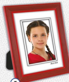
7 ZDJĘCIE Z EFEKTEM PASSE-PARTOUT W RAMCE PŁASTIKOWEJ 20 x 26 cm - CENA 31 zł