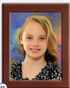
11 PORTRET W RAMCE PŁASTIKOWEJ 24 x 31 cm - CENA 35 zł