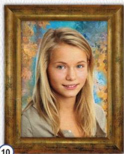
10 PORTRET DRUKOWANY NA PŁÓTNIE W ZŁOTEJ RAMCE PŁASTIKOWEJ 25 x 32 cm - CENA 41 zł