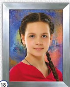
18 PORTRET W SREBRNEJ RAMCE PŁASTIKOWEJ 23 x 30 cm - CENA 35 zł