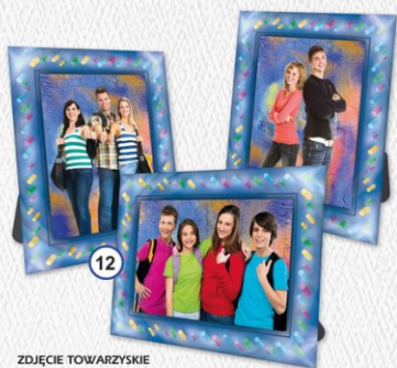
12 ZDJĘCIE TOWARZYSKIE W RAMCE TEKSTUROWEJ 18 x 23 cm - CENA 14 zł