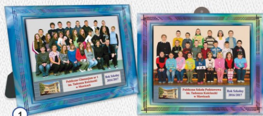
1 ZDJĘCIE GRUPOWE Z BUDYNKIEM SZKOŁY I OPISEM W RAMCE TEKSTUROWEJ 23 x 28 cm - CENA 14 zł MOŻLIWOŚĆ WYKONANIA ZDJĘCIA GRUPOWEGO Z PODŁOŻONYM TŁEM - CENA 16 ZŁ.

MOŻLIWOŚĆ WYKONANIA ALBUMU ZE ZDJĘCIEM GRUPOWYM Z PODŁOŻONYM TŁEM - CENA 25 ZŁ.