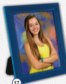
17 ZDJĘCIE W RAMCE PŁASTIKOWEJ WJĘCIE DOWOLNE 20 x 26 cm - CENA 31 zł