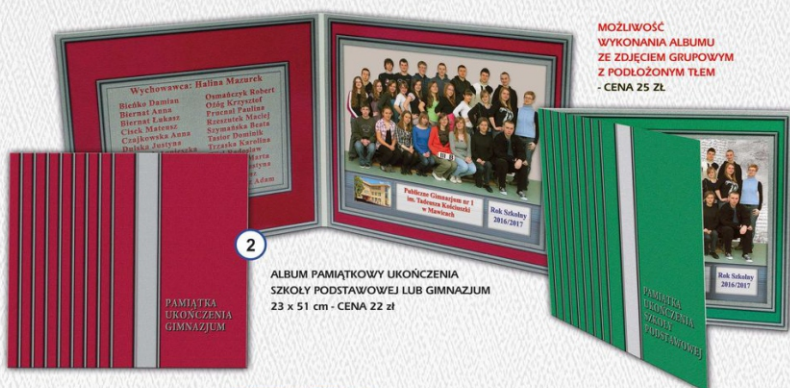
2 ALBUM PAMIĄTKOWY UKOŃCZENIA SZKOŁY PODSTAWOWEJ LUB GIMNAZJUM 23 x 51 cm - CENA 22 zł

MOŻLIWOŚĆ WYKONANIA ALBUMU ZE ZDJĘCIEM GRUPOWYM Z PODŁOŻONYM TŁEM - CENA 25 ZŁ.