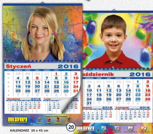
20 KALENDARZ 30 x 45 cm UWAGA!!! KALENDARZ AKTUALNE MINIMUM 12 MIESIĘCY OD MOMENTU DOSTARCZENIA - CENA 30 zł